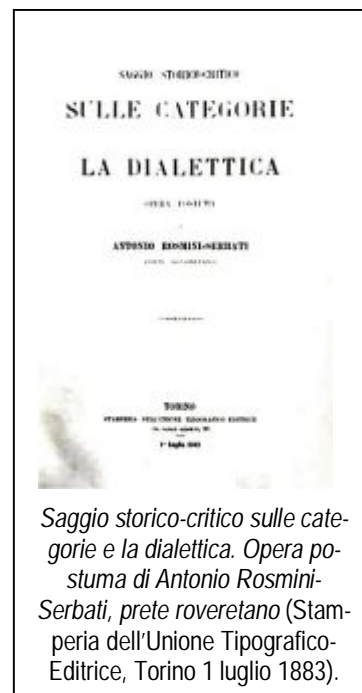
Saggio storico-critico sulle categorie e la dialettica. Opera postuma di Antonio Rosmini-Serbatì, prete roveretano (Stamperia dell'Unione Tipografico-Editrice, Torino 1 luglio 1883).

L'edizione critica del Saggio storico critico sulle categorie si apre con una Prefazione , nella quale Rosmini definisce le categorie come «le classi ultime a cui si riducono tutte le varietà dell'essere in qualunque modo concepibili alla mente umana» 9 . Queste classi ultime «sono fondate in concetti di comprensione massima virtuale, di maniera che in ciascuna di esse si trovi contenuto virtualmente il massimo di essere» 10 . Segue una Sezione I , denominata Le categorie – Parte storica , nella quale vengono esposti in appositi capitoli, distinti a loro volta in paragrafi, i principali risultati raggiunti dalla teoresi dei grandi filo-